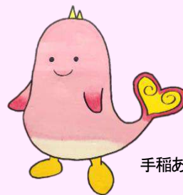
手稲あんじゅ公式キャラクター 「寿ごんのアンちゃん」