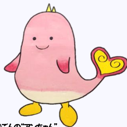
寿(じゅ)ごんの“アンちゃん”