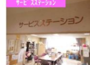
サービスステーション