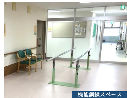
機能訓練スペース