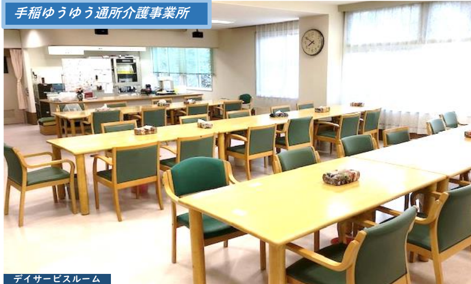
デイサービスルーム